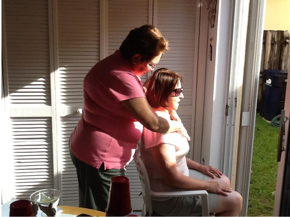
1 -TRIANGULO (LA FUERZA) EN EL CORAZON