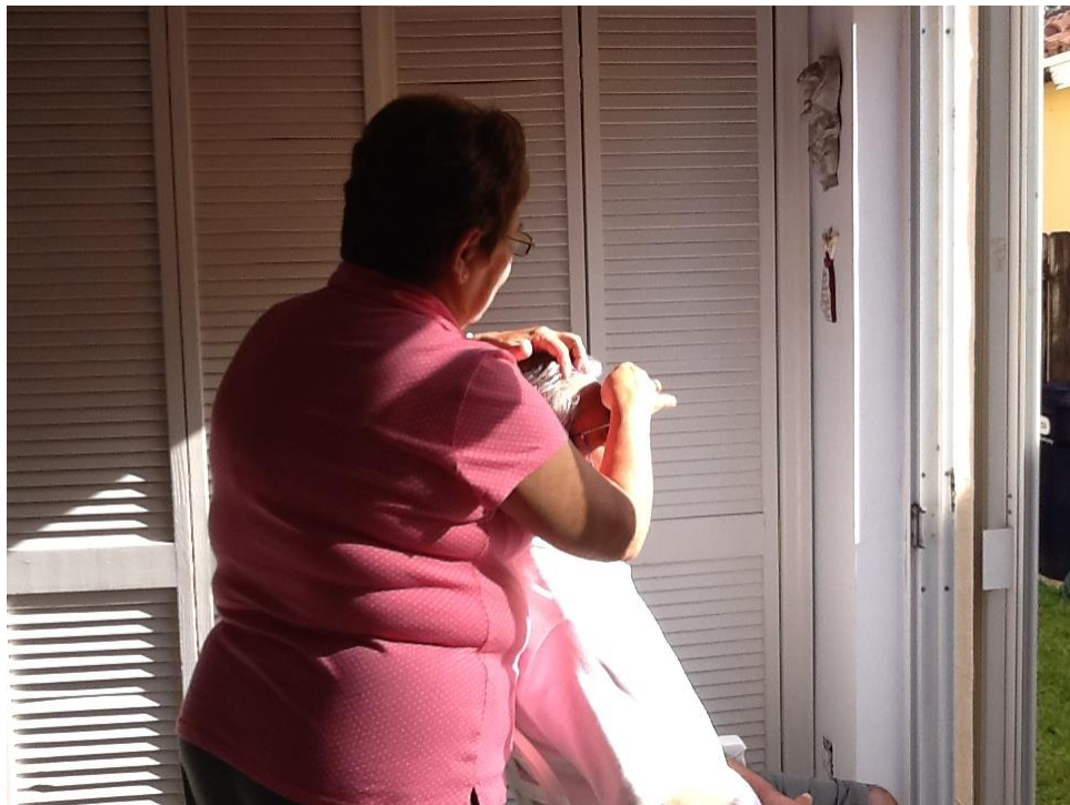
- 2.-APLICANDO SELLOS EN LA FRENTE